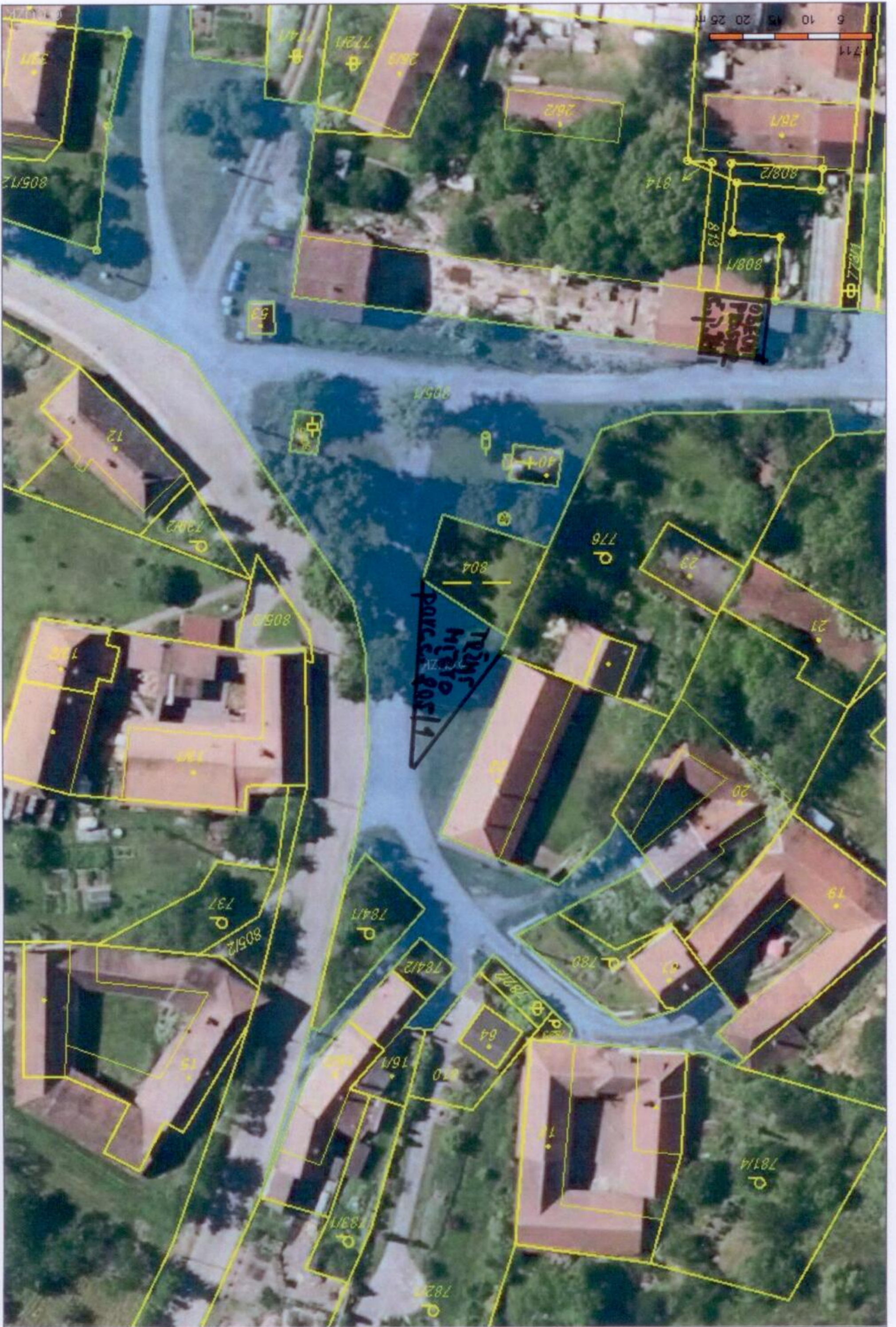
Priloha č.1 k OZV o místních poplatcích č.3/2015